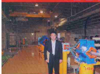
在日本参加亚核论坛协调会议期间 考察日本加速器应用情况

在承担国际原子能机构技术援助项目“建立与完善食品辐照质量标准体系”(CPR/05/16)过程中,