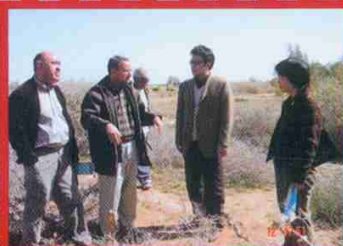
在突尼斯考察中子测水技术在盐碱地 修复中的应用