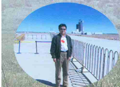
在酒泉卫星发射中心

联合国内多个核农学领域的研究机构共同开展工作, 利用项目内IAEA专家来华服务的机会组织开展学术交流, 积极推广项目成果。