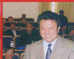
参加第7届中国原子能农学会 全国代表大会